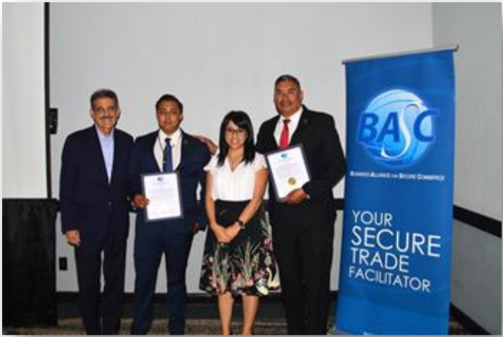
Se hizo la entrega de los certificados del segundo periodo del 2018 y el primer periodo del 2019 por parte de la Junta directiva de BASC USA y el Presidente Internacional de WBO.